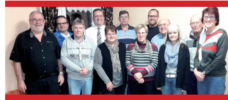
Ihre SWG Kandidaten